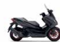
Νέο Χρώμα 2023 Special Edition Mat Cynos Gray Metallic