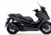
Νέο Χρώμα 2023 Mat Cynos Gray Metallic