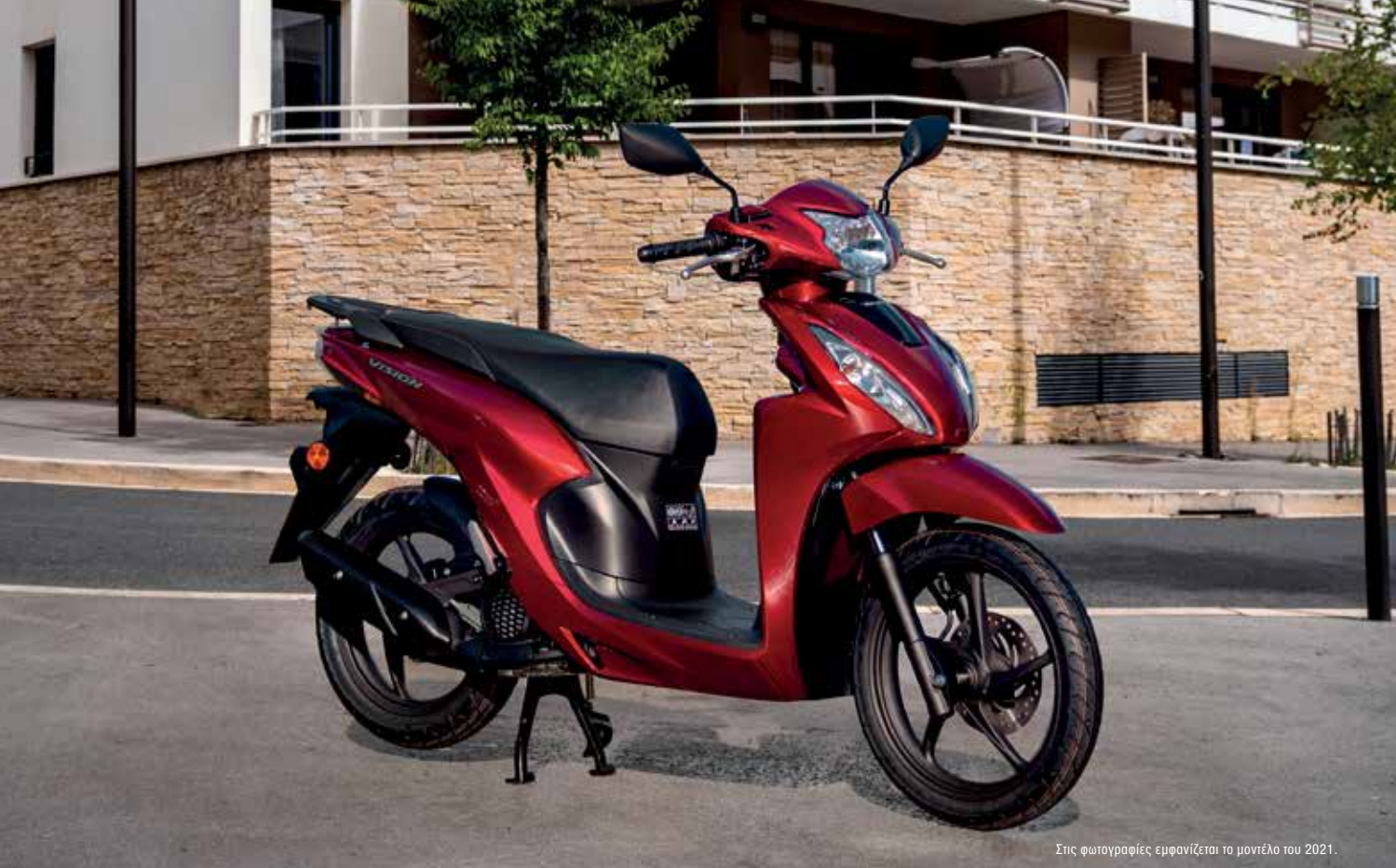
Στις φωτογραφίες εμφανίζεται το μοντέλο του 2021.