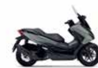
Νέο Χρώμα 2023 Pearl Falcon Gray