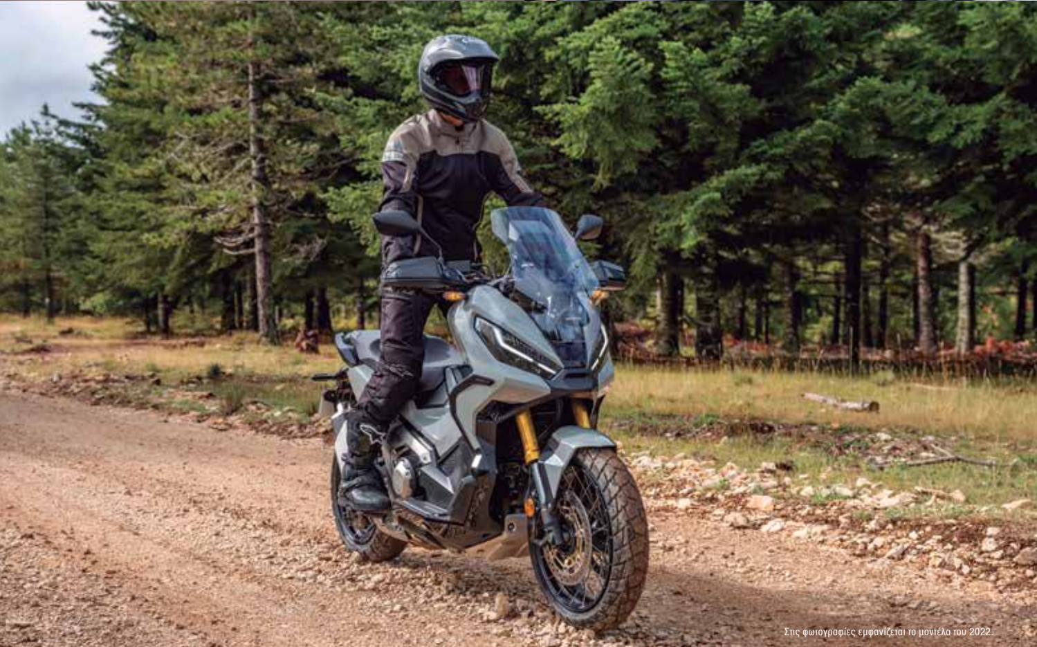
Στις φωτογραφίες εμφανίζεται το μοντέλο του 2022.