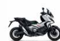
Νέο Χρώμα 2023 Xadv Shashta White