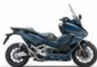
Νέο Χρώμα 2023 Mat Jeans Blue Metallic