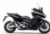
Νέο Χρώμα 2023 Graphite Black