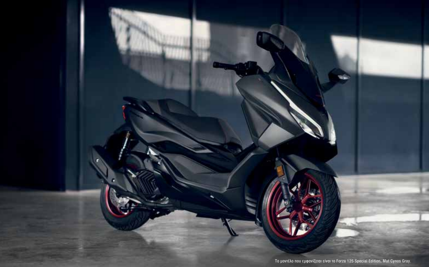
Το μοντέλο που εμφανίζεται είναι το Forza 125 Special Edition, Mat Cynos Gray.