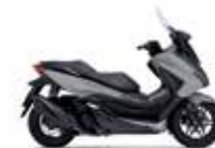
Νέο Χρώμα 2023 Pearl Falcon Gray