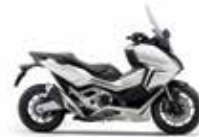
Νέο Χρώμα 2023 Mat Beta Silver Metallic