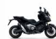
Mat Balistic Black Metallic