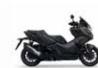
Mat Cynos Gray Metallic