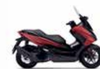
Νέο Χρώμα 2023 Mat Carnelian Red Metallic