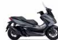
Νέο Χρώμα 2023 Mat Robust Gray Metallic