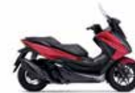
Νέο Χρώμα 2023 Pearl Siena Red