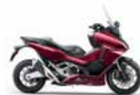
Νέο Χρώμα 2023 Candy Chromosphere Red