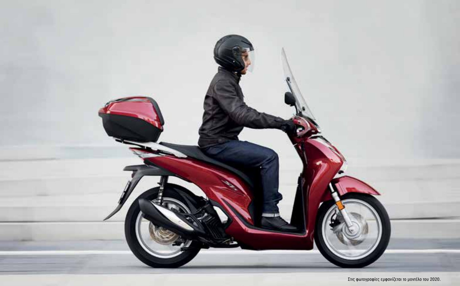
Στις φωτογραφίες εμφανίζεται το μοντέλο του 2020.