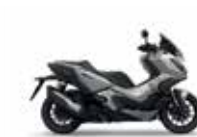
Pearl Deep Mud Grey