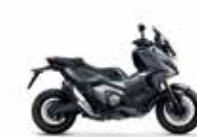
Mat Iridium Grey Metallic