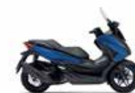
Νέο Χρώμα 2023 Pearl Mat Pearl Pacific Blue