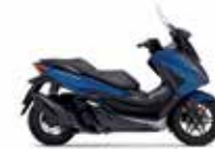
Νέο Χρώμα 2023 Mat Pearl Pacific Blue