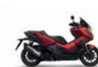
Mat Carnelian Red Metallic